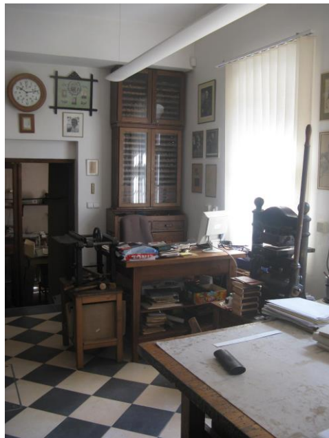
Pohled do obnovené knihařské dílny